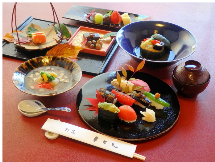
幸すしヴィーガンコース（一例）